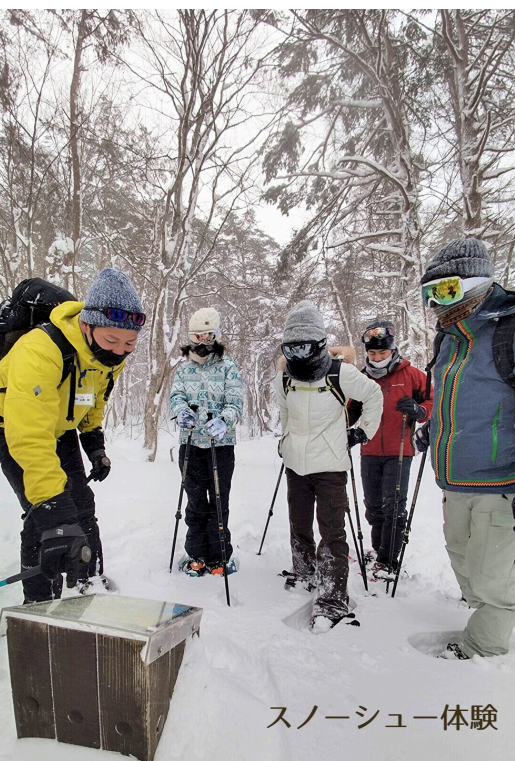
スノーシュー体験