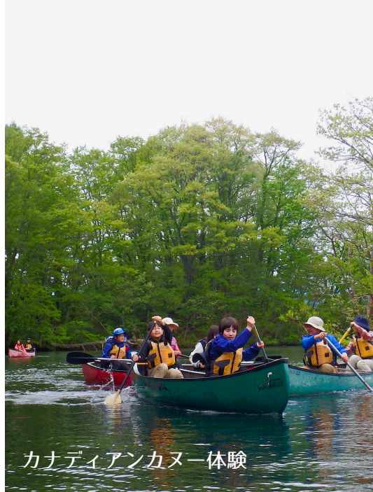
カナディアンカヌー体験