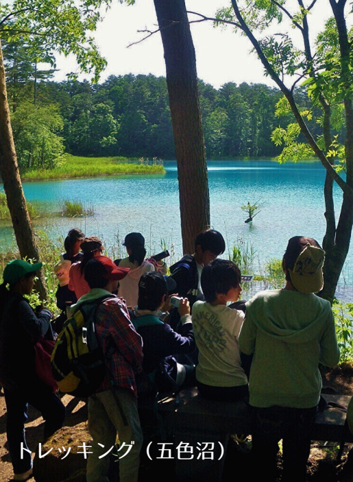
トレッキング（五色沼）